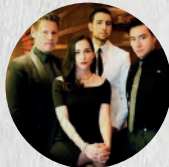
Catalyst Quartet, cuarteto de cuerdas