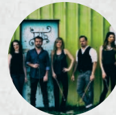
Sybarite5, quinteto de cuerdas