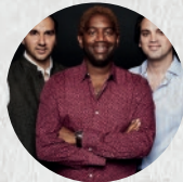
Bohemian Trio, saxofón, violonchelo y piano