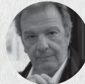
Pablo Ziegler, piano, arreglador y compositor