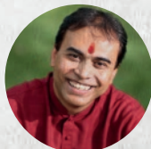
Sandeep Das, tabla virtuoso, solista y compositor